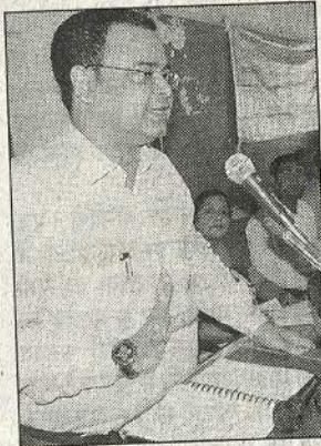
सम्बोधित करते मुख्य अतिथि